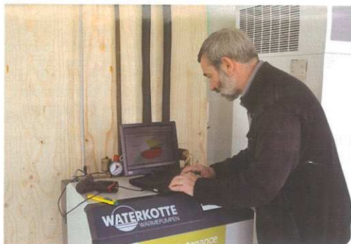
Possibilité de contrôle à distance d'une installation en Géothermie

Pour toute demande en isolation, veuillez contacter OPTIMUM, au 02 43 69 47 17 ou HYPERLINK "mailto:menuiserieoptimum@orange.fr" menuiserieoptimum@orange.fr